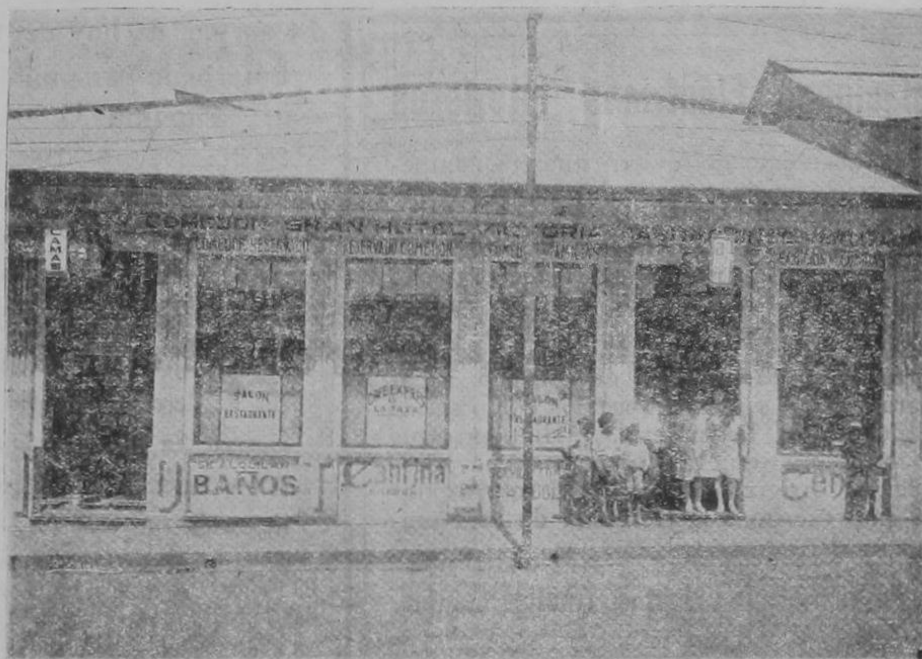
Fachada del Hotel