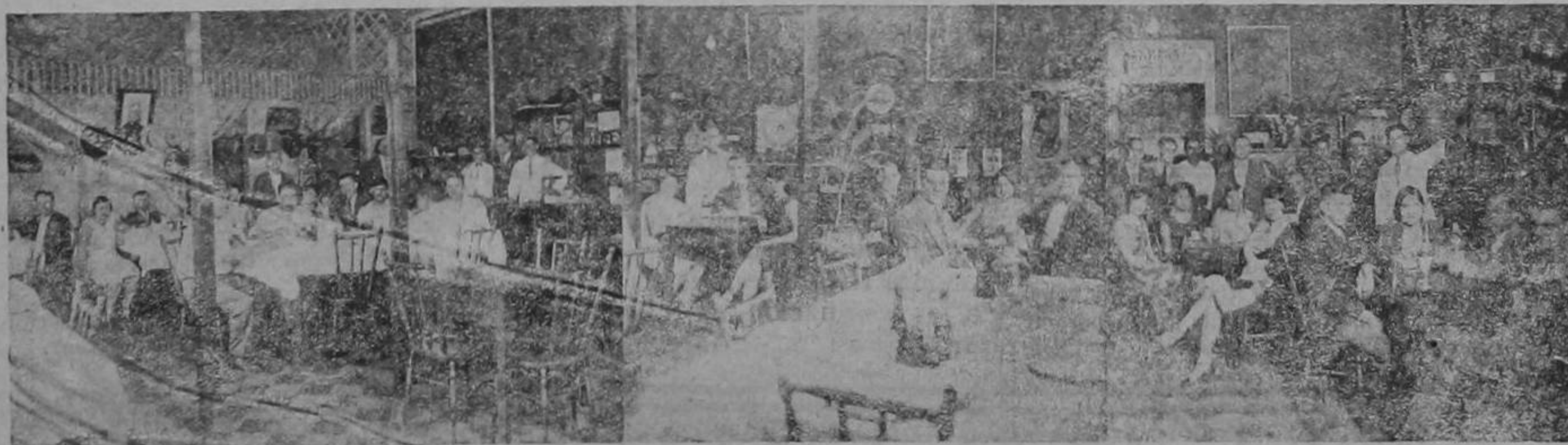
Salones de servicio en que caballeros y señoritas saborean el exquisito menú de este Hotel, a la hora de la cena