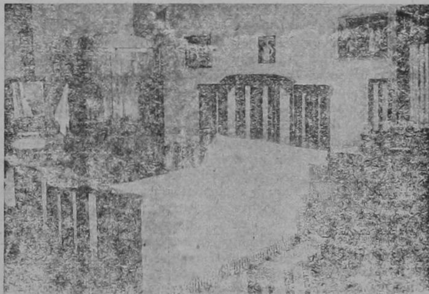
Habitaciones cómodas, amuebladas, especiales para familias, de 2, 3, 4 y 5 colones Disponibles a todas horas